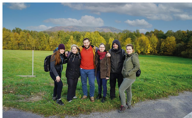
Mapování si vyzkoušel i tým MAS Pobeskydí.