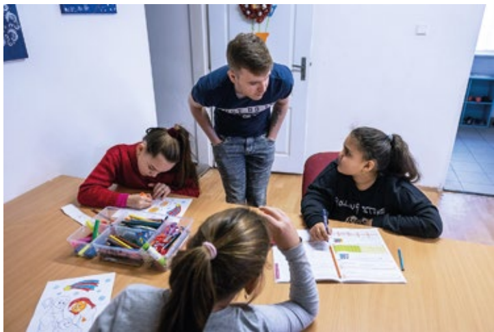
Obr. č. 3: Komunitní centrum Tulipán

V létě 2022 byl předložen a následně schválen projekt SPOKO Pobeskydí. Realizace projektu bude zahájena v lednu 2023. Projekt se zaměřuje na pomoc potřebným (osobám a rodinám v nepříznivých životních situacích a podporuje komunitní aktivity a prorodinné a mezigenerační programy. Společně s místními spolky podporuje venkovské komunitní tábory pro děti v osmi obcích povodí Ondřejnice. Na pomoc pečujícím a rodině v situacích odcházení blízké osoby se zaměřuje aktivita paliativní péče.