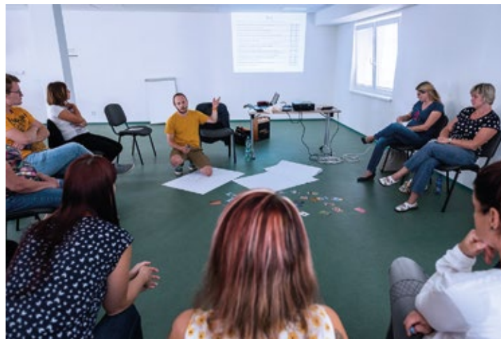
Obr. č. 4: Nebojte se TO řešit

„Pomáháme lidem a rodinám v tíživých životních situacích“