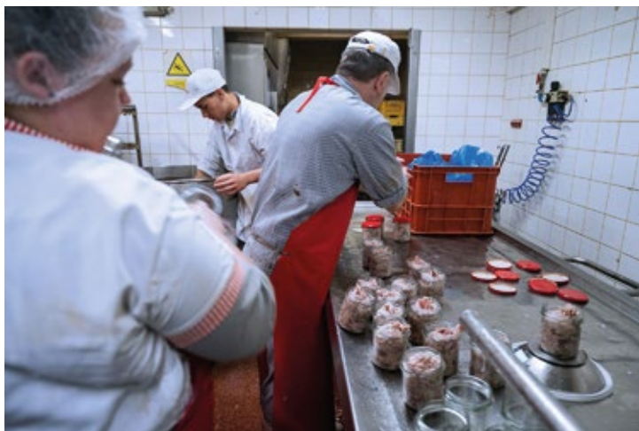
Obr. č. 12: Valašská zabijačka (Machač – malokapacitní jatka s.r.o.)

Rok 2022 byl třetím rokem koordinace regionální značky BESKYDY originální produkt, která je součástí rodiny více než třiceti regionálních značek sdružených pod Asociací regionálních značek. Značka je zárukou kvality, původu výrobku, šetrnosti k životnímu prostředí a originality. V Beskydech, v Pobeskydí a na Valašsku máme téměř čtyřicet jejích držitelů. Naleznete zde zejména výrobky, ale i první vlašťovky služeb a zážitků. Svou územní působností značka významně přesahuje Pobeskydí, a proto není koordinace jednoduchá a je potřeba spolupracovat s dalšími organizacemi.