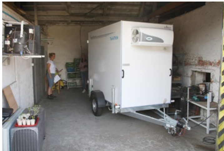
Obr. č. 6: Dovybavení bourárny v Chotěbuzi

Do konce roku 2022 byla úspěšně ukončena realizace 142 projektů (z toho ve fichi Investice do zemědělství 65 projektů, ve fichi Zemědělské produkty deset projektů, ve fichi Místní nezemědělská produkce 22 projektů, ve fichi Investice do lesnictví šest projektů a ve fichi Občanská vybavenost 39 projektů).