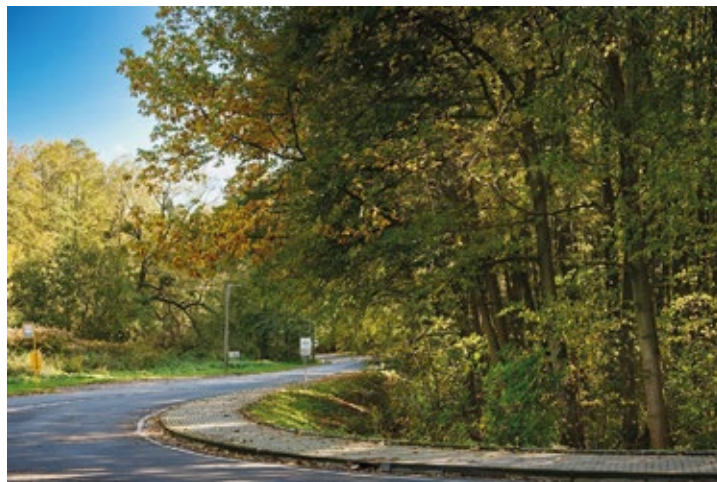
Obr. č. 1: Chodník ve Vojkovicích

V roce 2022 byly vyhlášeny dvě výzvy. Jedna v Programu rozvoje venkova zaměřená na všechny fiche (přijato bylo 107 žádostí a vybráno k podpoře 93 projektů) a druhá v Integrovaném regionálním operačním programu (IROP) zaměřená na podporu vzdělávací infrastruktury (přijato k podpoře byl jeden projekt).