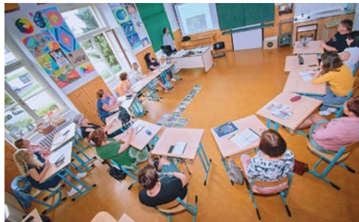
Obr. č. 11: Festival inspirace v přírodních vědách