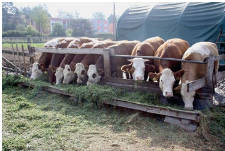
Obr. č. 5: Stroje a technologie pro farmu ve Staré Vsi nad Ondřejnicí

V únoru 2022 byla vyhlášena sedmá výzva PRV zaměřená na všechny fiche. Žadatelé do ní předložili rekordní počet 107 žádostí. V této výzvě bylo vybráno k podpoře devatenáct projektů z fiche Investice do zemědělství, sedm projektů z fiche Zemědělské produkty, čtrnáct projektů z fiche Místní nezemědělská produkce, dvanáct projektů z fiche Investice do lesnictví a 41 projektů z fiche Občanská vybavenost.