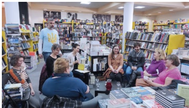
Obr. č. 9: Jednání pracovní skupiny Čtenářská gramotnost

Řídící výbor, který je nejvyšším orgánem projektu, v průběhu roku rozhodoval podle potřeby (celkem čtyřikrát) mimo zasedání prostřednictvím e-mailové komunikace. Na počátku roku a projektu schválil jeho základní dokumentaci, následně pak aktualizaci strategického rámce a seznamu investičních priorit, roční akční plán 2023 a vyhodnocení předchozího projektu, Místního akčního plánu Frýdek-Místek II.