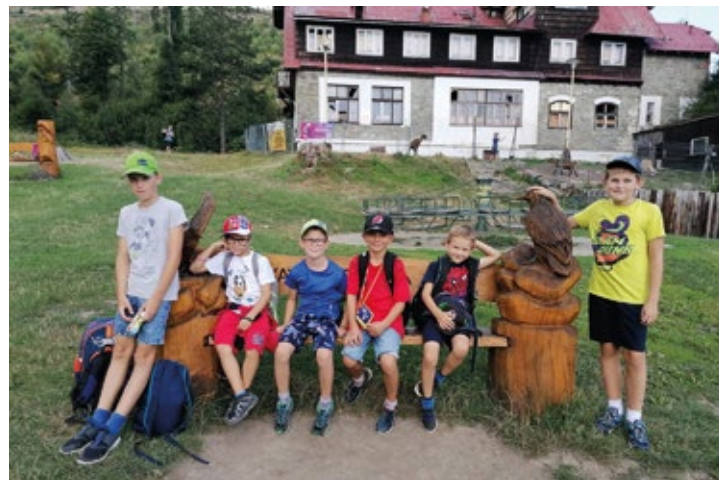
Obr. č. 10: Příměstský tábor v Kozlovicích

MAS Pobeskydí v programovém rámci operačního programu Zaměstnanost podala vlastní projekty. V roce 2022 pokračovala realizace druhého projektu, Příměstské tábory v Pobeskydí II. Tentokrát jsme připravili devatenáct turnusů v Dobraticích, Hukvaldech, Fryčovicích, Kozlovicích, Nošovicích, Třanovicích a zimní turnus v Bruzovicích. Táborů se zúčastnilo přes 290 dětí ze 241 rodin. Z projektu bylo hrazeno hlídání, pronájem prostor a sportovišť, drobné vybavení, pomůcky a materiál a pro každý turnus jedna animační akce. Na děti vždy čekal bohatý program s pohybem, tvořením, zkoumáním, zážitky i hlavolamy.