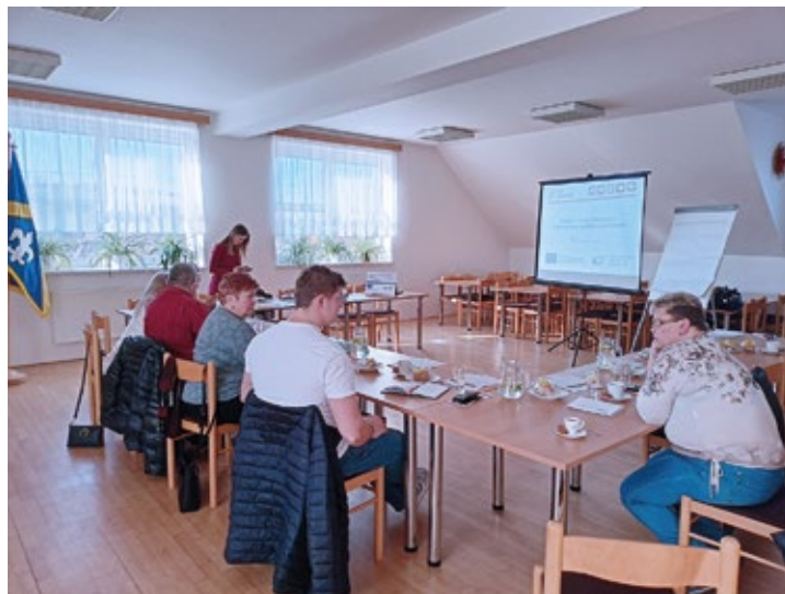
Obr. č. 8: Setkání místní komunity k identifikaci potřeb a problémů“

Významnou animační aktivitou je animace a metodická pomoc pro školy a školská zařízení ve výzvách operačního programu Výzkum, vývoj a vzdělávání, zaměřených na podporu škol formou projektů zjednodušeného vykazování – šablon. Metodická pomoc se týká nejenom přípravy projektové žádosti, ale pokračuje i v průběhu realizace projektu. Školy se mohou na naši animátorku bezplatně obrátit také s dílčími problémy. V roce 2022 jsme měli možnost touto cestou spolupracovat na šablonách škol z Těrlic-ka, Stříteže, Třanovic, Smilovic, Soběšovic, Horních Domašovic, Staré Vsi nad Ondřejnicí, Lučiny a dalších.