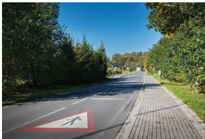
Obr. č. 2: Chodník ve Vojkovicích

„Podporujeme bezpečnou cestu ke školám i do práce“