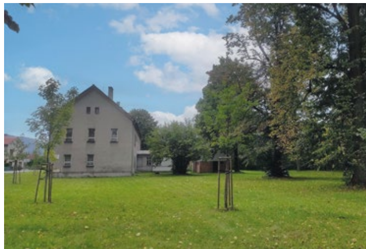
Obr. č. 7: Nové výsadby na Hukvaldech

V opatření Intravilány a veřejná prostranství (sídelní zeleň) byly přijaty čtyři projekty, z nichž tři jsou úspěšně realizovány. V první roce realizace většinou probíhala výsadba a v dalších letech probíhá následná péče.