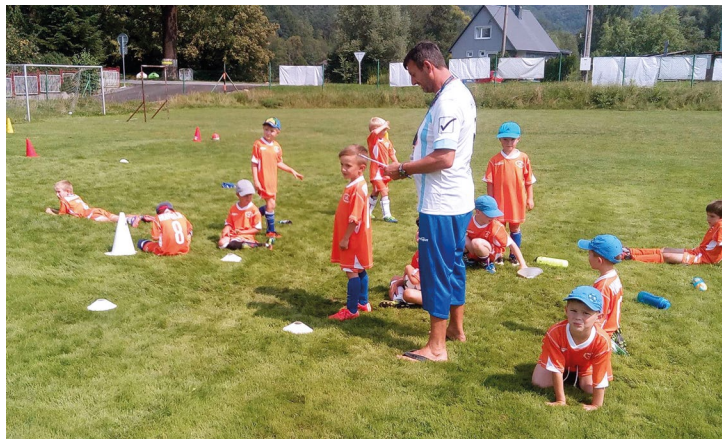
Obr. č. 27: Sportovní příměstské tábory na Hukvaldech

Projekt bude trvat i v dalších dvou letech a celkově by měl zrealizovat min. 36 turnusů.