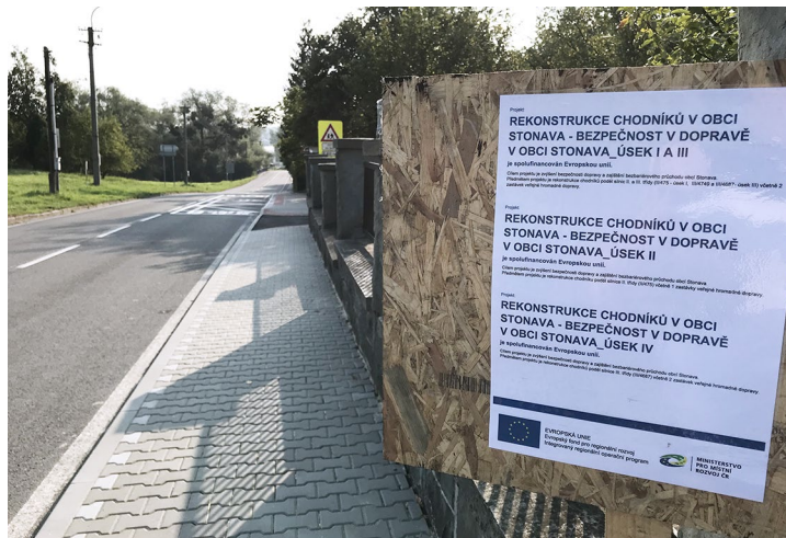
Obr. č. 10: Chodník v obci Stonava

„Zvyšujeme bezpečnost podporou modernizace a výstavby chodníků“