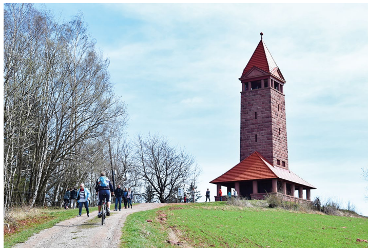
Obr. č. 31: Studijní cesta po Euroregionu Glacensis

V rámci projektu byly v roce 2018 realizovány studijní cesty a cyklovýlety, zpracována cyklomapa obou území. První studijní cesta proběhla 23. 3. 2018 do Bielska Białej. Druhá studijní cesta 13. až 14. 4. 2018 do oblasti Orlických hor účastníky seznámila s rozhlednami v Euroregionu Glacensis. Projekt byl ukončen cyklovýletem z Třanovic do Ochab 26. 5. 2018.