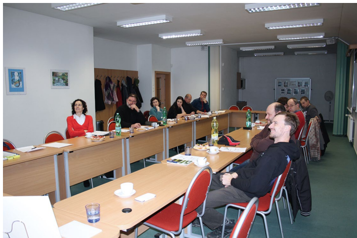
Obr. č. 21: Školení pro příjemce 8.1.2018 – Třanovice