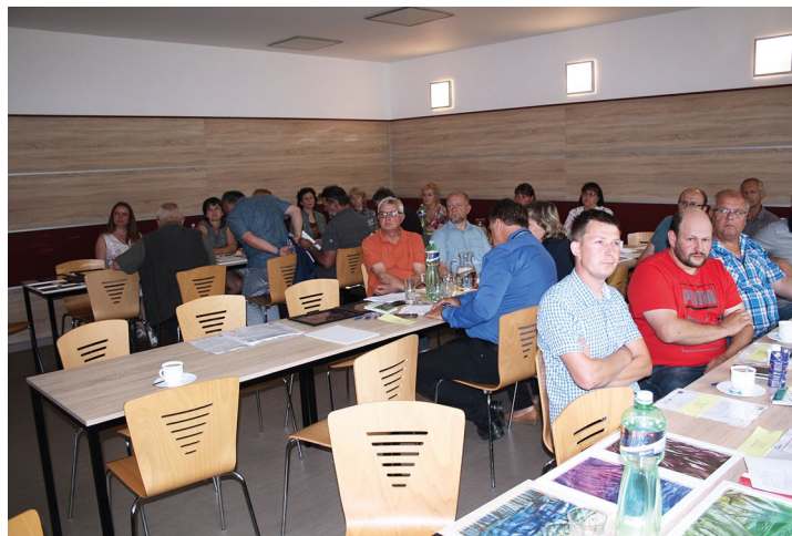
Obr. č. 3: Zasedání valné hromady 22. 5. 2018