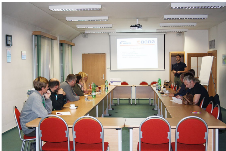
Obr. č. 23: Jednání pracovních skupin 8. 11. 2018 – Třanovice