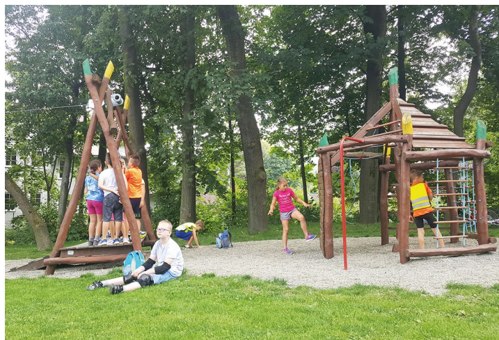
Obr. č. 28: Těrlické příměstské tábory