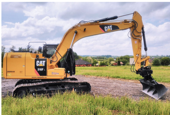
Obr. č. 19: Minibagr pro Silesia Cargo CZ s.r.o.