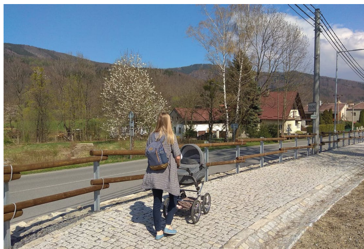
Obr. č. 8: Chodník v obci Pražmo