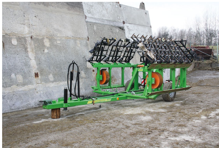
Obr. č. 15: Smykobrána pro Farmu Krásná s.r.o.