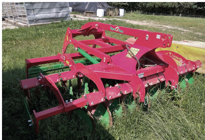
Obr. č. 16: Diskový podmítač pro p. Samuela Przeczka

„Motivujeme rodinné a místní farmy k rozvoji“