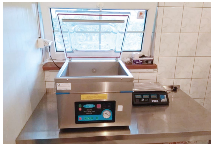
Obr. č. 18: Jaromír Grzeš - vakuovačka

„Přibližujeme místní potraviny místním lidem“