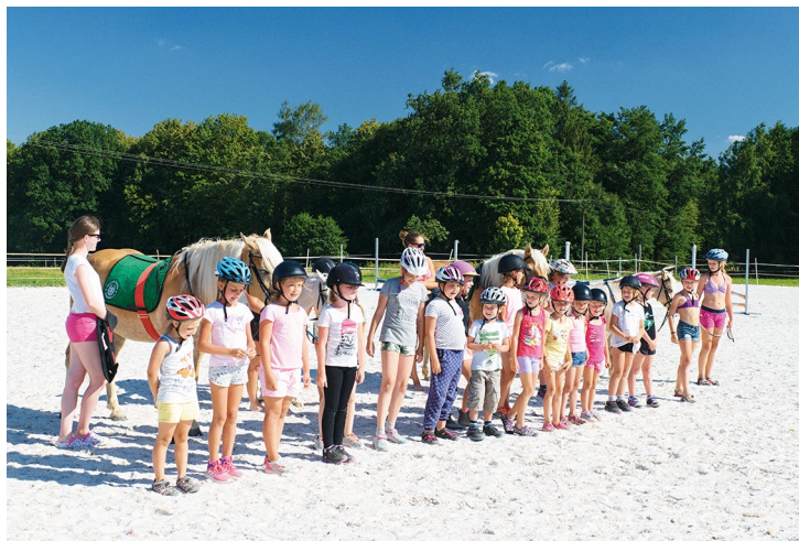
Obr. č. 29: Pony kemp ve Vělopolí