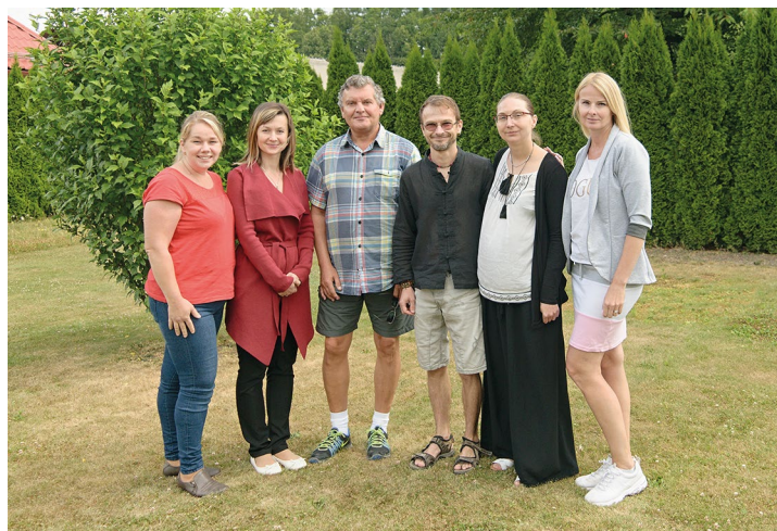
Obr. č. 2: Realizační tým projektu MAP II