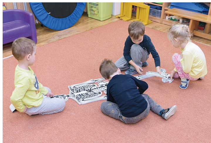
Obr. č. 26: Tematické kufříky pro rozvoj čtenářské gramotnosti