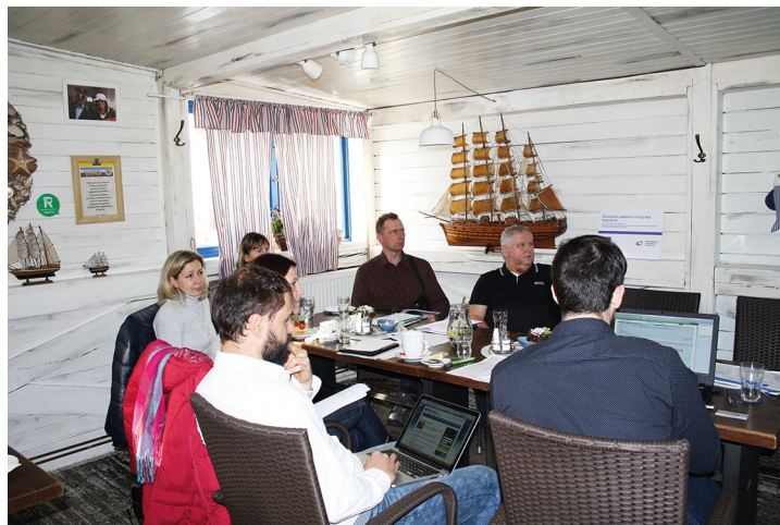
Obr. č. 22: Školení pro žadatele 5. 2. 2018 – Hukvaldy