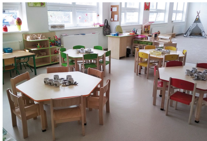
Obr. č. 12: Mateřská škola ve Smilovicích

„Podporujeme školy a školky plné nových zážitků a inspirace“