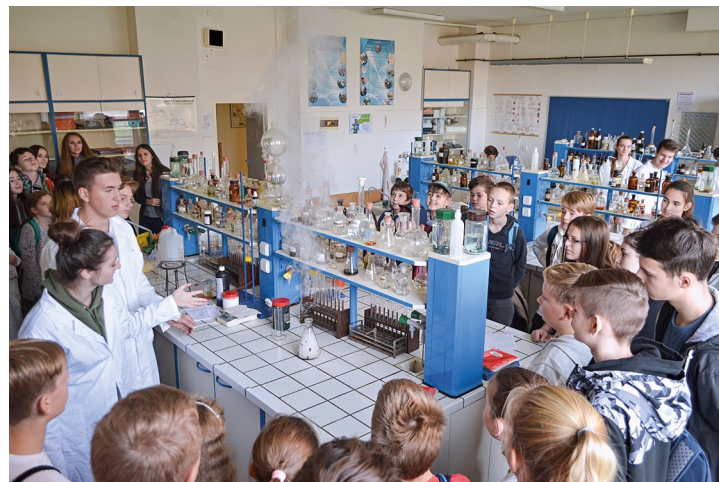
Obr. č. 25: Zlatá cihla a Zlatá cihlička

Většina aktivit pokračuje i v roce 2019. Další 16 aktivit bude v roce 2019 zahájeno.