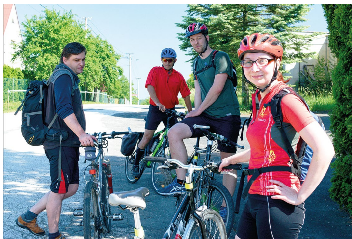
Obr. č. 32: Cyklovýlet Třanovice – Ochaby