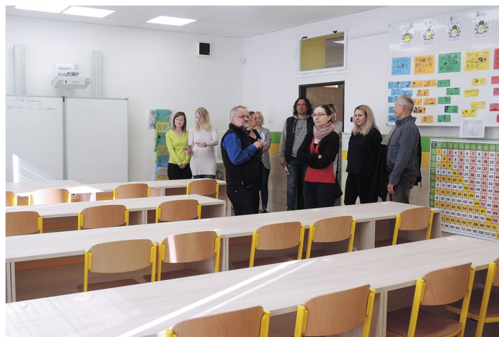
Obr. č. 11: Odborná učebna Základní školy Lučina