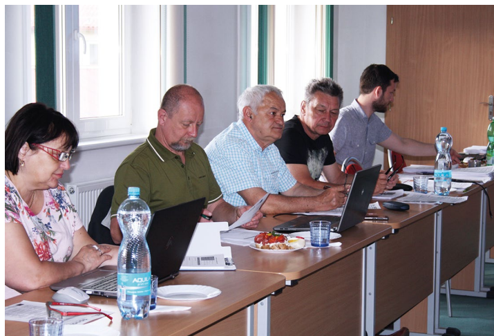
Obr. č. 4: Zasedání výběrové komise MAS 24. 4. 2018