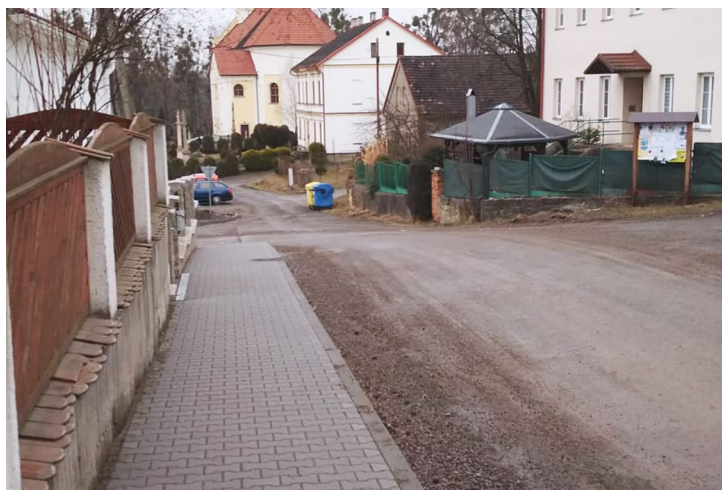
Obr. č. 7: Chodník v obci Horní Domaslavice