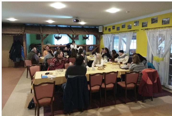
Obr. č. 24: Koně v Pobeskydí 28. 2. 2018 – Třanovice