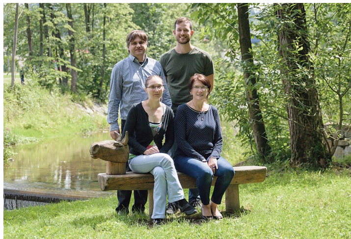
Obr. č. 1: Pracovní tým místní akční skupiny

Dále byly zapojeny další osoby na základě dohod o provedení práce.