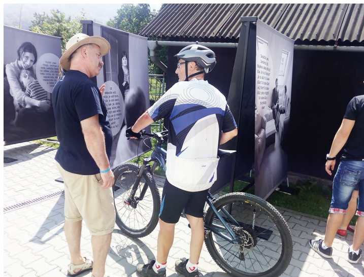
Obr. č. 13: Den pro rodinu v Komorní Lhotce

Cílem projektu je prevence sociálního vyloučení posílením rodinných a rodičovských kompetencí, rozvojem komunikační a psychosociální dovednosti, posílením osobních kompetencí v běžném životě u rodin pečujících o děti. Tím projekt také přispívá k posílení jejich sebedůvěry pro zapojení do komunity a obnovení či upevnění kontaktu s přírodním sociálním prostředím.