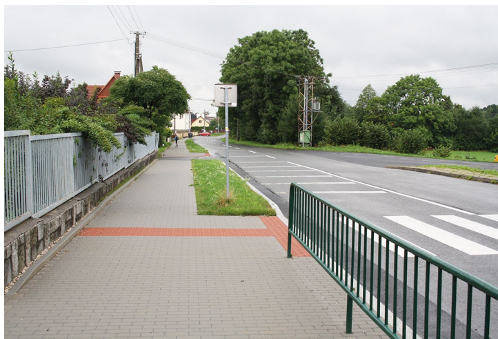
Obr. č. 9: Chodník v obci Raškovice