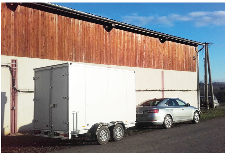
Obr. č. 17: Chladírenský vozík pro Přemysla Motičku