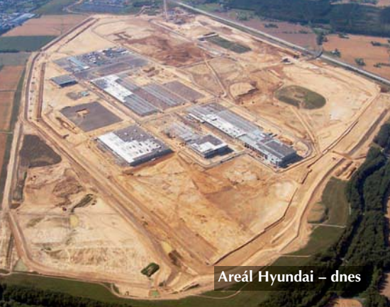
Areál Hyundai – dnes