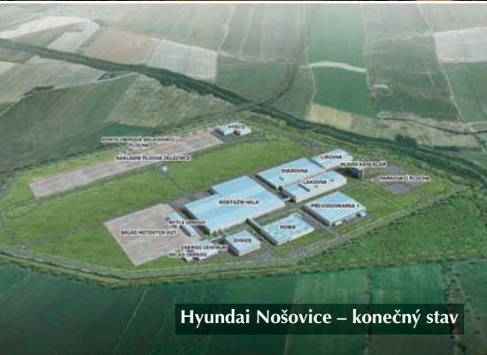
Hyundai Nošovice – konečný stav